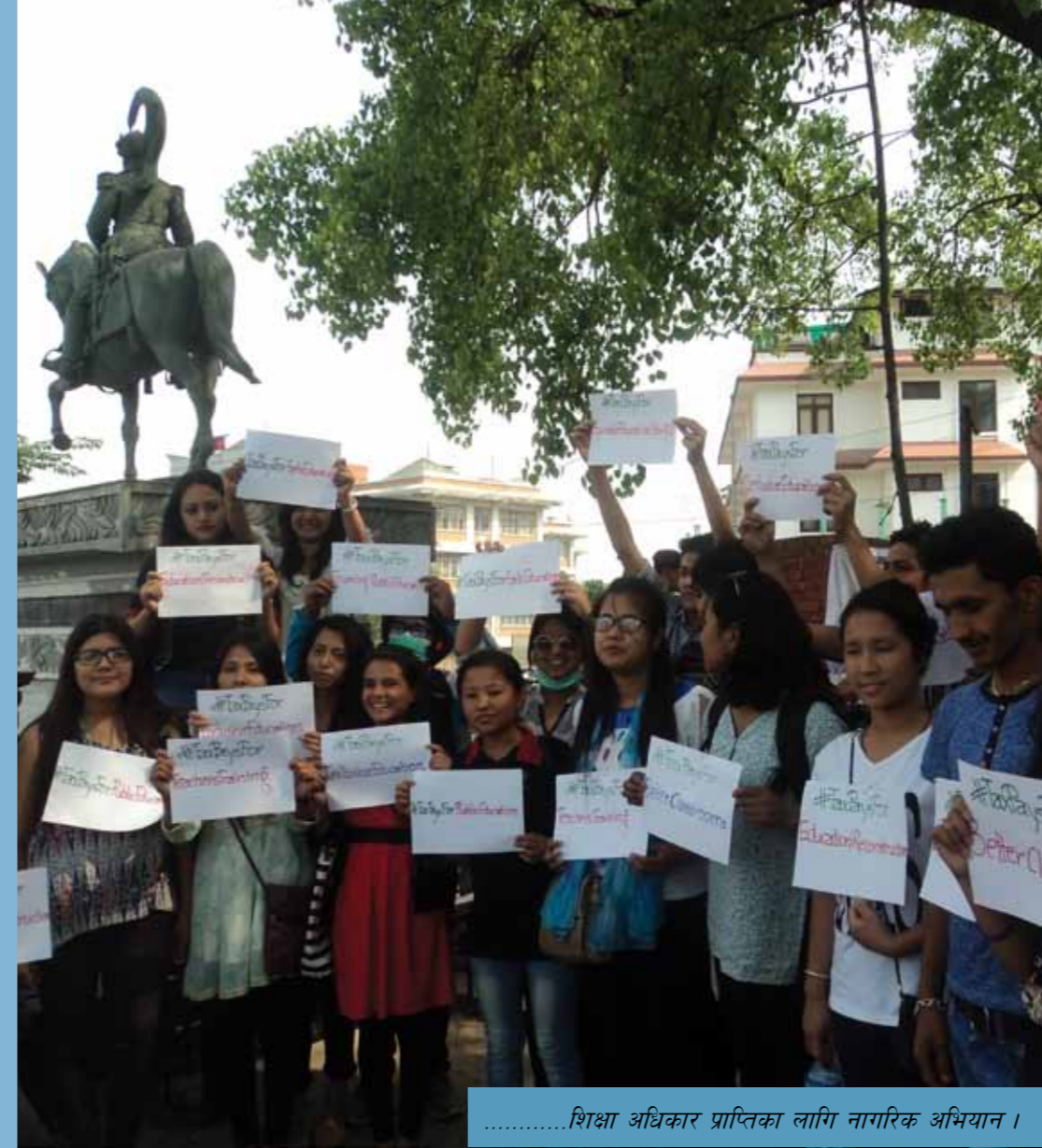
.....शिक्षा अधिकार प्राप्तिका लागि नागरिक अभियान ।

शिक्षाका लागि राष्ट्रिय अभियान नेपाल बखुण्डोल, ललितपुर, नेपाल फोन नं : ०१५५२६६७१, ०१६२०३००९ पो.ब.नं : १४४२१ इमेल : info@ncenepal.org.np वेबसाइट : www.ncenepal.org.np